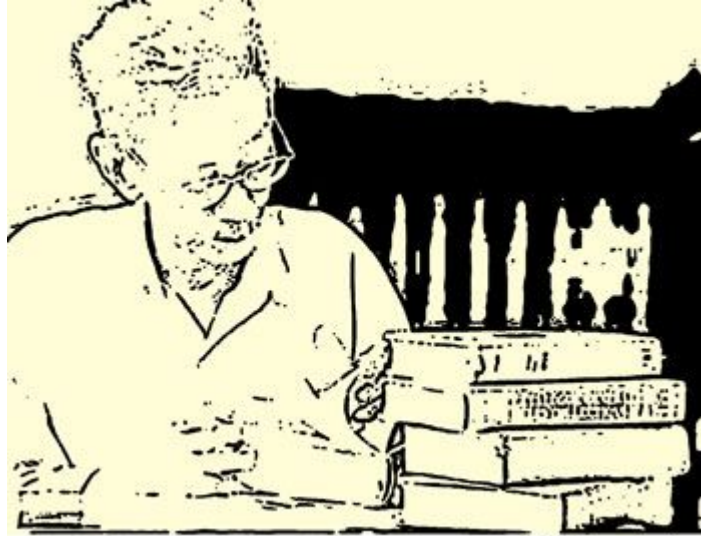
Minh họa của Amy

Như dòng sông êm dịu Vắt qua dòng thời gian Câu thơ thầy đã viết Trong trẻo một tiếng lòng Rung lên nhịp thôn thức Cháy khát niềm ước mong.